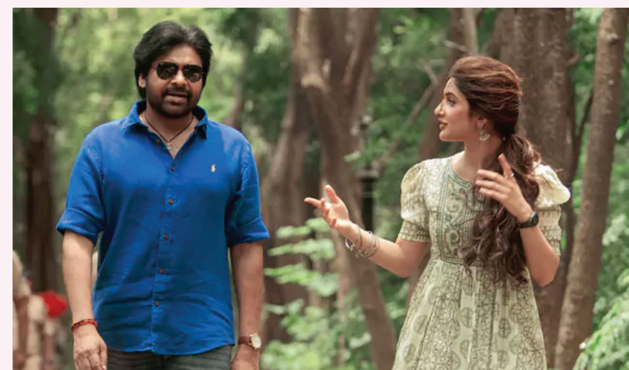
మూవీపై ఆసక్తిని పెంచింది. ఇక ఇప్పుడు అసలు కార్యక్రమం ఉంది. అదే ఉస్తాద్ భగత్ సింగ్ ట్రైలర్. దానిని అనుకున్న టైమ్ కు పర్ఫెక్ట్ కట్స్ తో ఎలాంటి ఇబ్బంది లేకుండా విడుదల చేయగలిగితే మిగిలింది ఫ్యాన్స్ చూసుకుంటారు. అలాగే ప్రీ రిలీజ్ ఈవెంట్ ఎప్పుడు? ఎక్కడ పెడతారు? అన్నదానిపై స్పష్టత రావాల్సి ఉంది.

తొలుత అనుకున్న షెడ్యూల్ ప్రకారం మార్చి 26న ఈ మూవీ విడుదల కావాల్సి ఉంది. ‘టాక్సిక్’ వాయిదాతో వారం ముందుకు జరిగింది. వరుస సెలవుల నేపథ్యంలో ‘ఉస్తాద్’ ముందుకు రావడం మంచి నిర్ణయమే అయినా, ‘ధురంధర్ 2’ నుంచి గట్టి పోటీ ఎదుర్కొని నిలబడాలి. మూవీ విడుదల, టికెట్స్ విషయంలో ‘ధురంధర్ 2’ చాలా స్పష్టంగా ఉంది. ఇప్పటికే పెయిడ్ ప్రీమియర్స్ టికెట్స్ ఓపెన్ అయ్యాయి. మొదటి భాగం అంచనాలను పెంచిన నేపథ్యంలో ‘పార్ట్ 2’ బుకింగ్స్ హాట్ కెక్స్ గా అమ్ముడవుతున్నాయి. రెగ్యులర్ షోలకు సంబంధించి టికెట్స్ ఇంకా ఓపెన్ చేయలేదు. ఈ క్రమంలో ‘ఉస్తాద్’ ముందున్న అసలు సవాల ప్రతి అప్డేట్ పక్కాగా ఆన్ టైమ్ లో తీసుకురావడమే. ఇప్పటికే విడుదల చేసిన ట్రైలర్ టీజ్