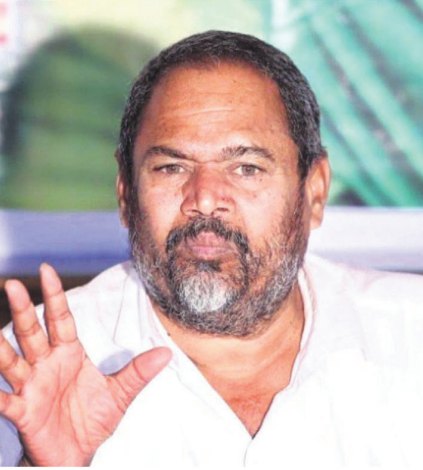
భూపేన్ హజారికాకు ఇచ్చిన గౌరవం ఎంత గొప్పదో, తెలంగాణ ప్రభుత్వం కూడా గడ్డర్ కు అదే స్థాయి గౌరవాన్ని ఇచ్చిందని పేర్కొన్నాడు.

రాష్ట్ర ప్రభుత్వం ప్రతిష్టాత్మకంగా ప్రారంభించిన గడ్డర్ సిని పురస్కారాలు సిని పరిశ్రమలో చర్చనీయాంశంగా మారాయి. ఇటీవల ఓ కార్యక్రమానికి హాజరైన ప్రముఖ నటుడు, దర్శకుడు ఆర్. నారాయణమూర్తి గడ్డర్ పేరుతో పురస్కారాలు ప్రకటించిన ప్రభుత్వంపై ప్రశంసలు కురిపించాడు. ఎన్నో సంవత్సరాల తర్వాత సిని రంగానికి ప్రత్యేక గౌరవం దక్కేలా ఈ అవార్డులు ఏర్పాటు చేయడం గొప్ప విషయమన్నాడు. ఆయన పేరుతో పురస్కారాలు ఇవ్వడం తెలంగాణ సంస్కృతి, పోరాట చరిత్రకు గర్వించు గా నిలుస్తుందన్నాడు. విభవ గాయకుడు ప్రజల మనసుల్లో ఎప్పటికీ జీవించే వ్యక్తిని, ఆయన పాటలు సమాజంలో చైతన్యం తీసుకొచ్చాయని చెప్పాడు. తెలంగాణ గడ్డపై ప్రతి ఇంట్లో గడ్డర్ వంటి స్ఫూర్తిదాయక వ్యక్తులు ఉంటారని వ్యాఖ్యానించాడు. అస్సాంలో ప్రముఖ గాయకుడు భూపేన్ హజారికాకు ఇచ్చిన గౌరవం ఎంత గొప్పదో, తెలంగాణ ప్రభుత్వం కూడా గడ్డర్ కు అదే స్థాయి గౌరవాన్ని ఇచ్చిందని పేర్కొన్నాడు.